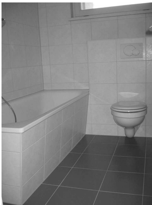
Bad in der Carl-Zeiß-Straße 46

Im Jahr 2010 sind auch zwei Gewerbeeinheiten in der Carl-Zeiß-Straße 46 (früher Arztpraxis) und in der Industriestraße 52 (vormals Kosmetikstudio) wieder frei geworden. Da zu diesem Zeitpunkt kein kurzfristiger Bedarf für eine erneute Gewerbevermietung bestand, haben wir uns entschlossen, diese beiden Einheiten wieder als Wohnungen zu vermieten. Dies bedeutete zwar im Fall der Carl-Zeiß-Straße 46