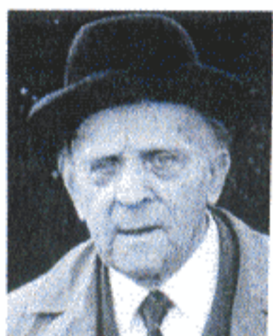
Architekt Hans Richter (1882 – 1971).

Flachdachhäuser standen zwar unter Denkmalschutz, waren aber in einem „erbärmlichen Zustand“. Vor allem hätten „die zahlreichen bautechnischen ‚Experimente‘ des Architekten“ aus heutiger Sicht zu besonderen Problemen geführt, ja den Verfall beschleunigt.