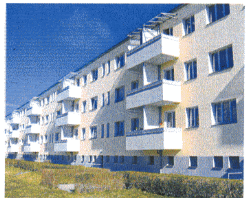
Bauten der Moderne in Sachsen: Die zum großen Teil im Bauhausstil errichteten Gebäude im denkmalgeschützten Areal im Dresdner Stadtteil Trachau-Nord hat die Bürgergenossenschaft auf bemerkenswerte Art und im Sinne des Denkmalschutzes saniert. Fast 90 Prozent der Häuser sind inzwischen mit Balkonen oder Loggien ausgestattet.

Flachdachhäuser standen zwar unter Denkmalschutz, waren aber in einem „erbärmlichen Zustand“. Vor allem hätten „die zahlreichen bautechnischen ‚Experimente‘ des Architekten“ aus heutiger Sicht zu besonderen Problemen geführt, ja den Verfall beschleunigt.